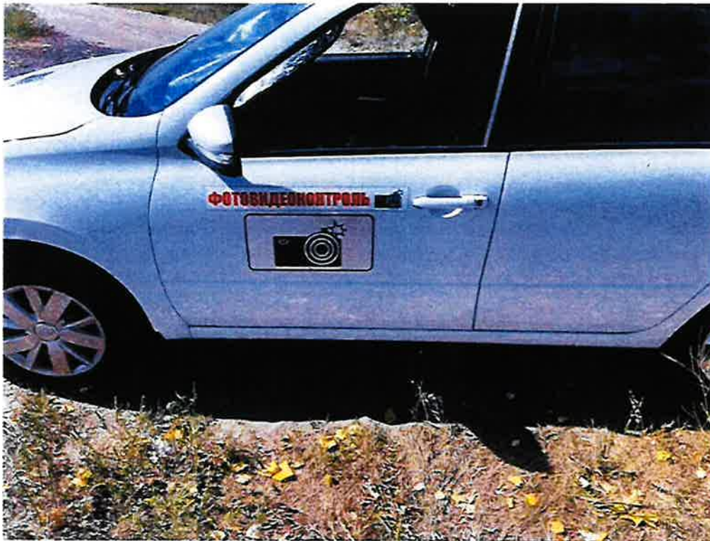
Опознавательные знаки на передней двери водителя транспортного средства