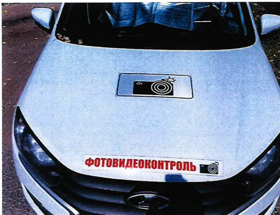
Опознавательные знаки на капоте транспортного средства