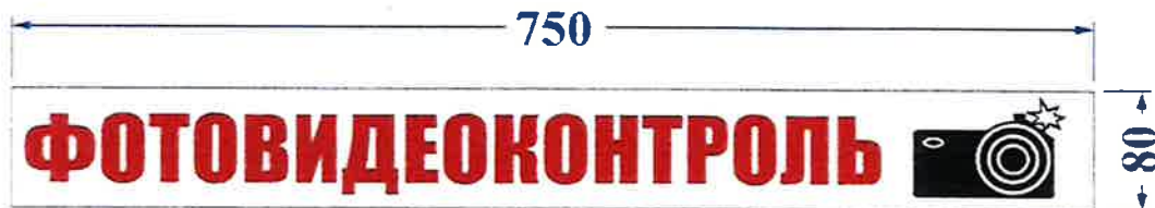
Опознавательный знак «Фотовидеоконтроль»