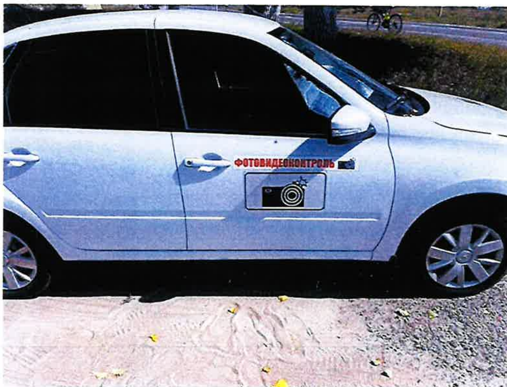
Опознавательные знаки на передней двери пассажира транспортного средства