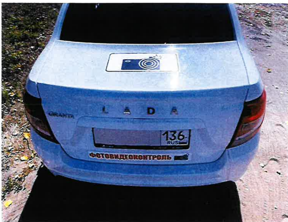
Опознавательные знаки на крыше багажника транспортного средства